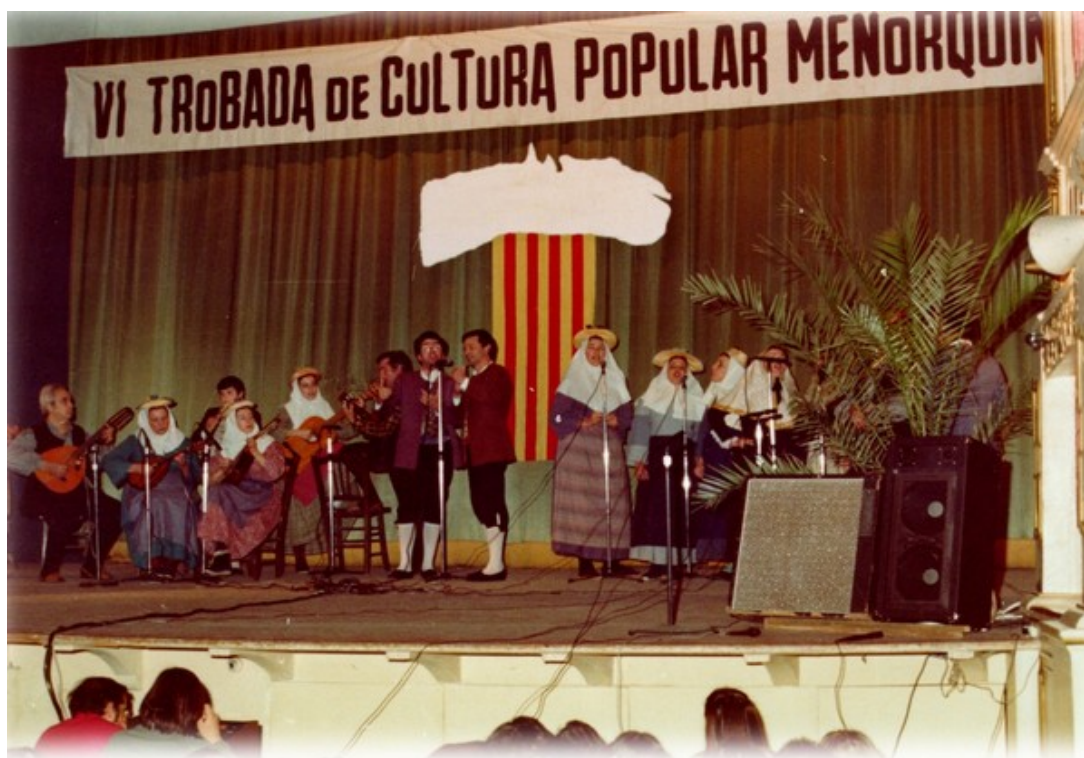
Imatge de la Trobada de Cultura Popular de 1981