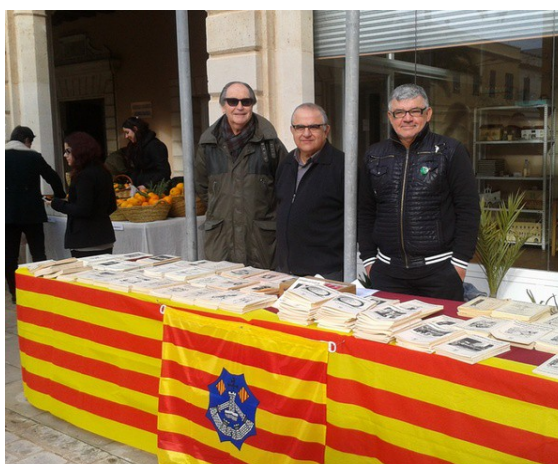
Els membres del Col·lectiu Folkloric a la parada dels Quaderns, el matí de la Diada, a la plaça de Sant Antoni

«N'hem parlat en diverses ocasions —assenyalen els components del Col·lectiu—. En principi, però, optam per mantenir la col·lecció en suport paper, no passar-la al suport digital. I creim que el suport paper s'ha de mantenir per diverses raons: a) pel tipus de lector que compra i llig els quaderns; b) per la visibilitat que dóna aquest suport; i c) per respecte als col·leccionistes que s'han preocupat durant tants d'anys de crear una col·lecció, enquadrar-la, estimar-la... Posar material en el món digital és cert que ajuda a ampliar l'accés; però consideram que és fer-nos competència a nosaltres mateixos en una empresa que només sobreviu gràcies a la venda dels quaderns.»