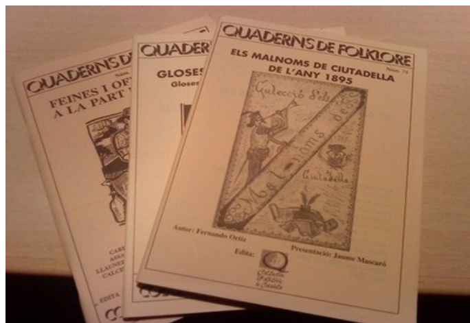
Les gloses, els oficis antics i l'antroponímia són alguns dels temes més tractats en els Quaderns

- Oficis antics : amb un total de 10 quaderns publicats en què es descriu com es feien antany oficis com els de carreter, trencador, mestre d'aixa, assaonador, cosidora, ribeller, calciner, paredador, seller, entre molts altres, així com totes les feines i eines utilitzades en les tasques pròpies del calendari agrícola menorquí.